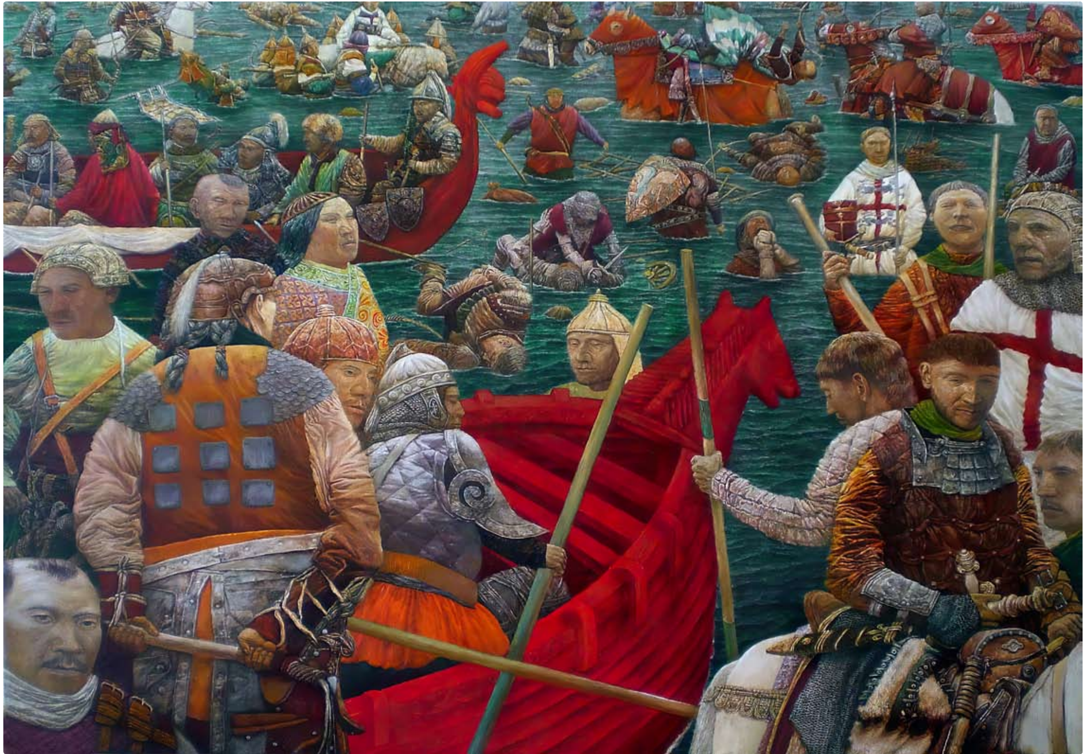
Crossing Genghis Khan across the English Channel