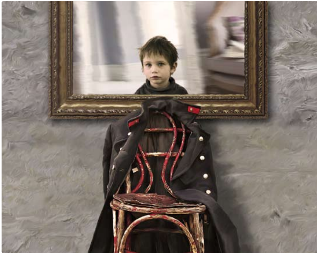
My father's greatcoat