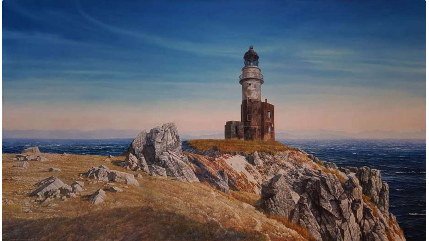
Shikotan Island Cape the Konets sveta. Oil on canvas, 95x170cm, 2019

«Буває, працюєш так багато і натхненно, що вже здається: ну нарешті, ось Воно! Але вранішнє світло нещадно розвіює ілюзії, починаєш переробляти»