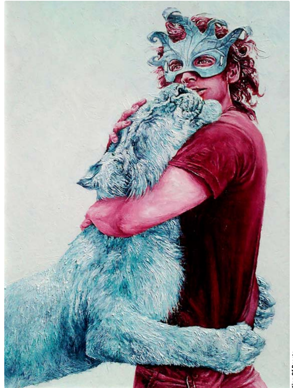
King Of Beasts