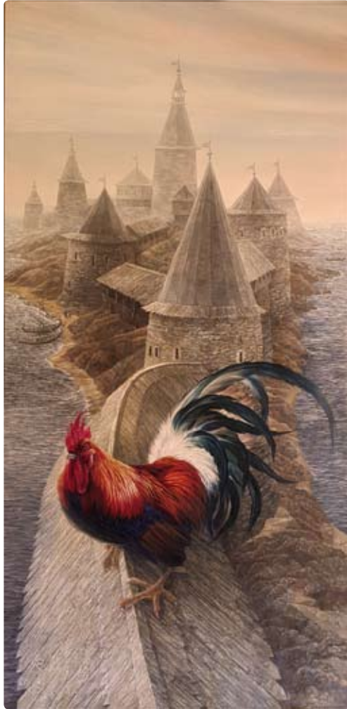
The Royal Bird