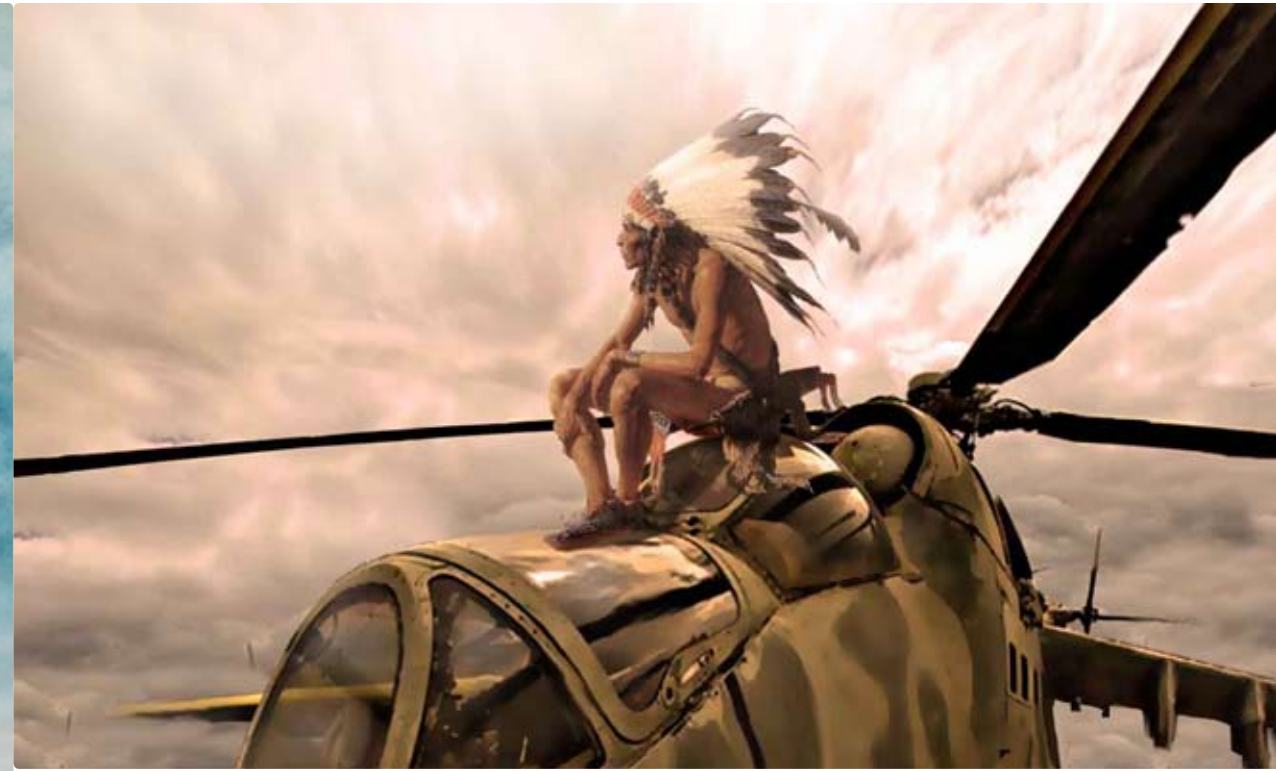
Wind in feathers

фу, театру, мандрівок, спілкування з цікавими людьми. Лякає смерть рідних і близьких. Невідома дата власної смерті — не лякає, але нагадує про необхідність не витрачати даремно час, що залишився.