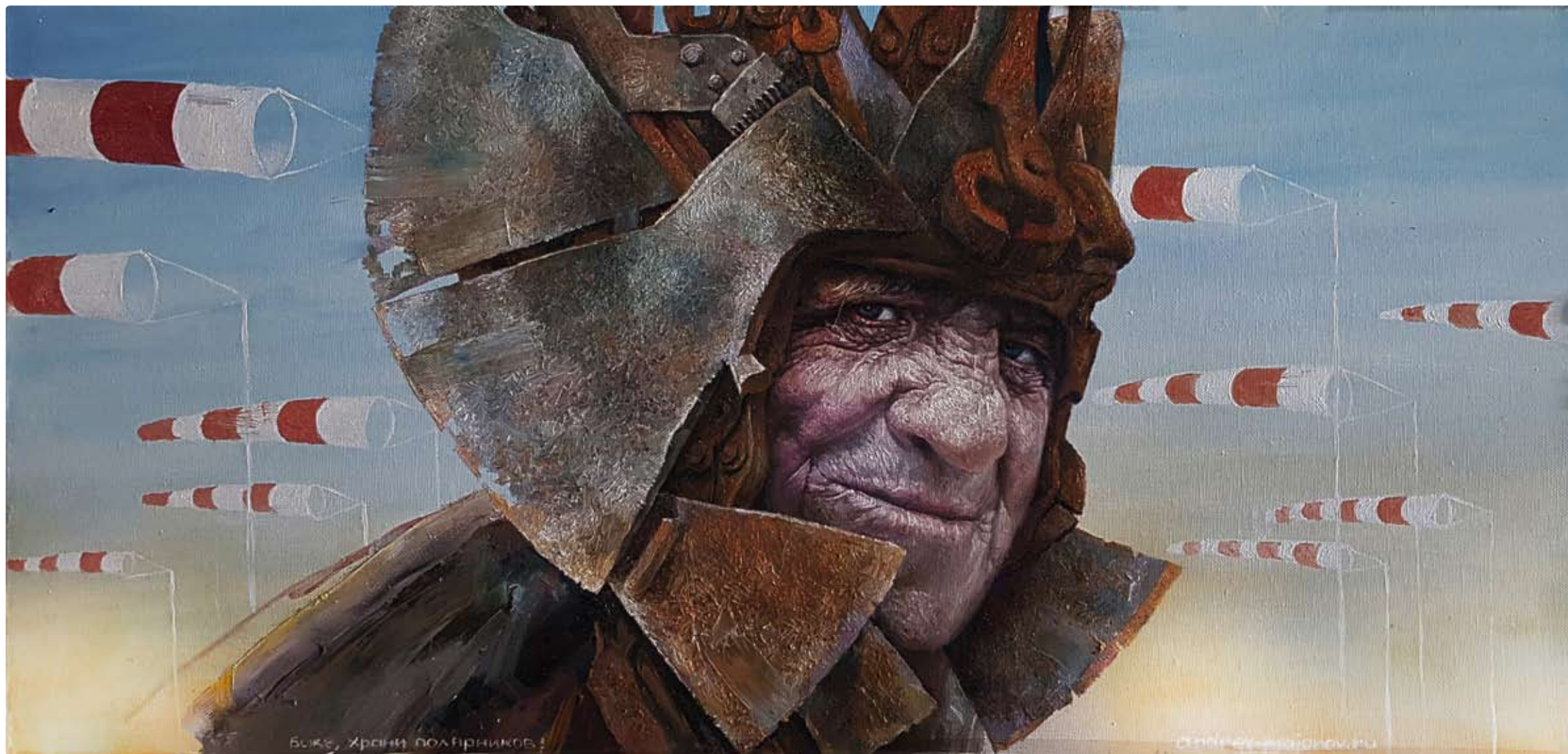
God save the Polar Explorers! 110x60см, хм

ШО На які важливі етапи ви би розділили свою творчість? Вектор вашого руху сьогодні?