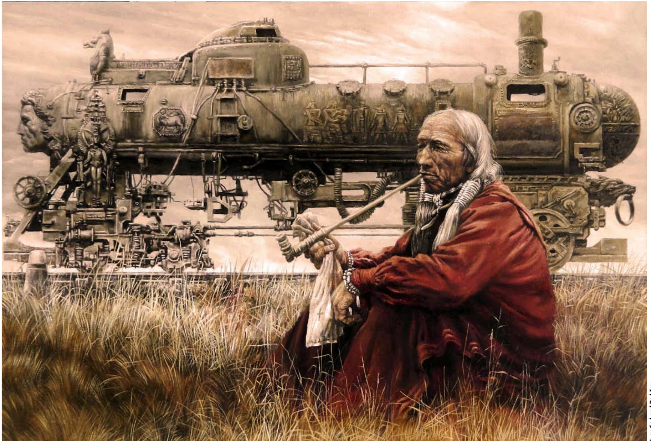
Iron God and Red Fox