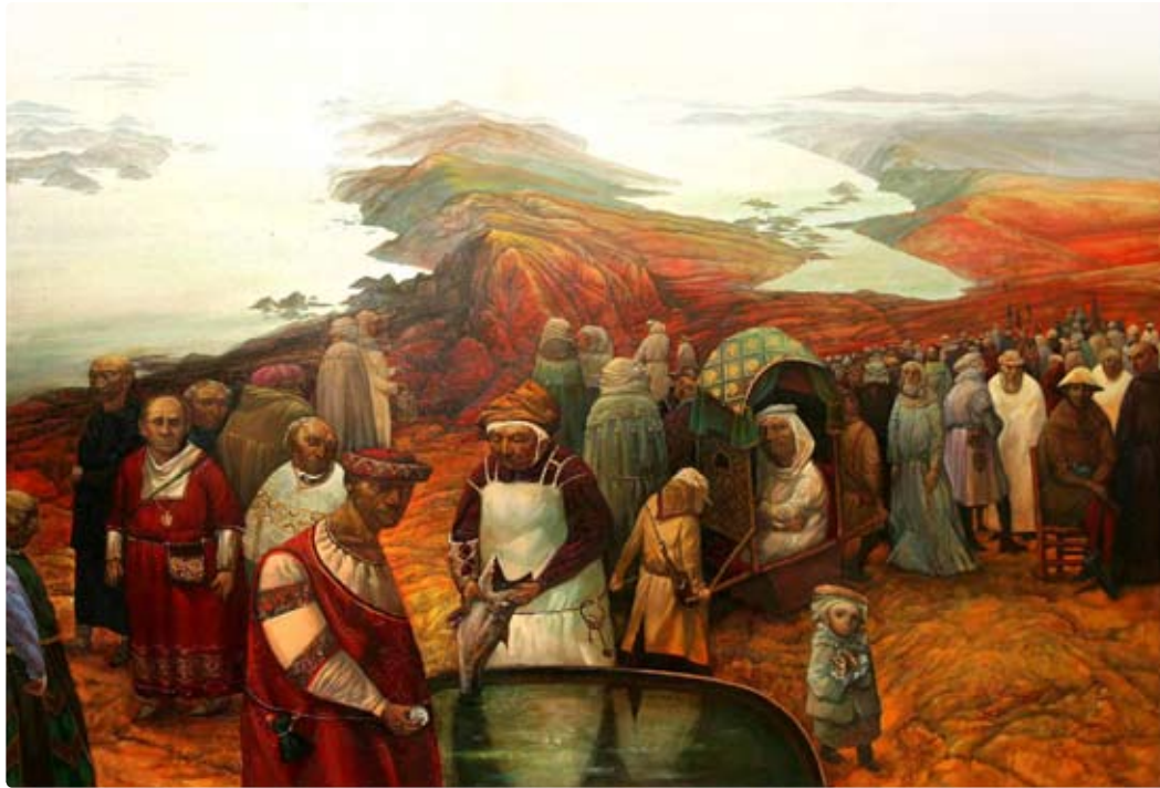
Miracle with a stater