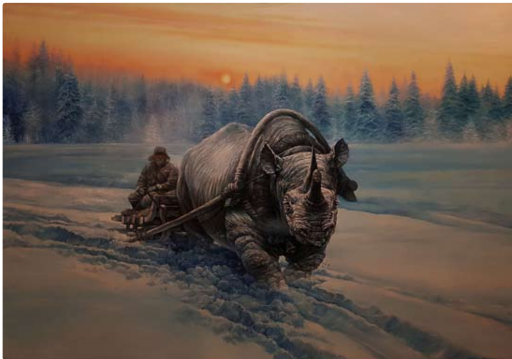
The long and windy road. 110x170cm, 2016г, хм