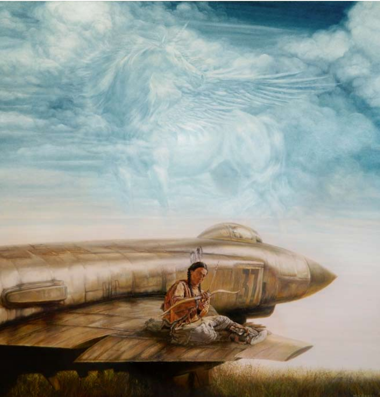
The Hunter and the Unicorn

ШО Життя цікаве й чудове? Чому? Смерть лякає чи?..