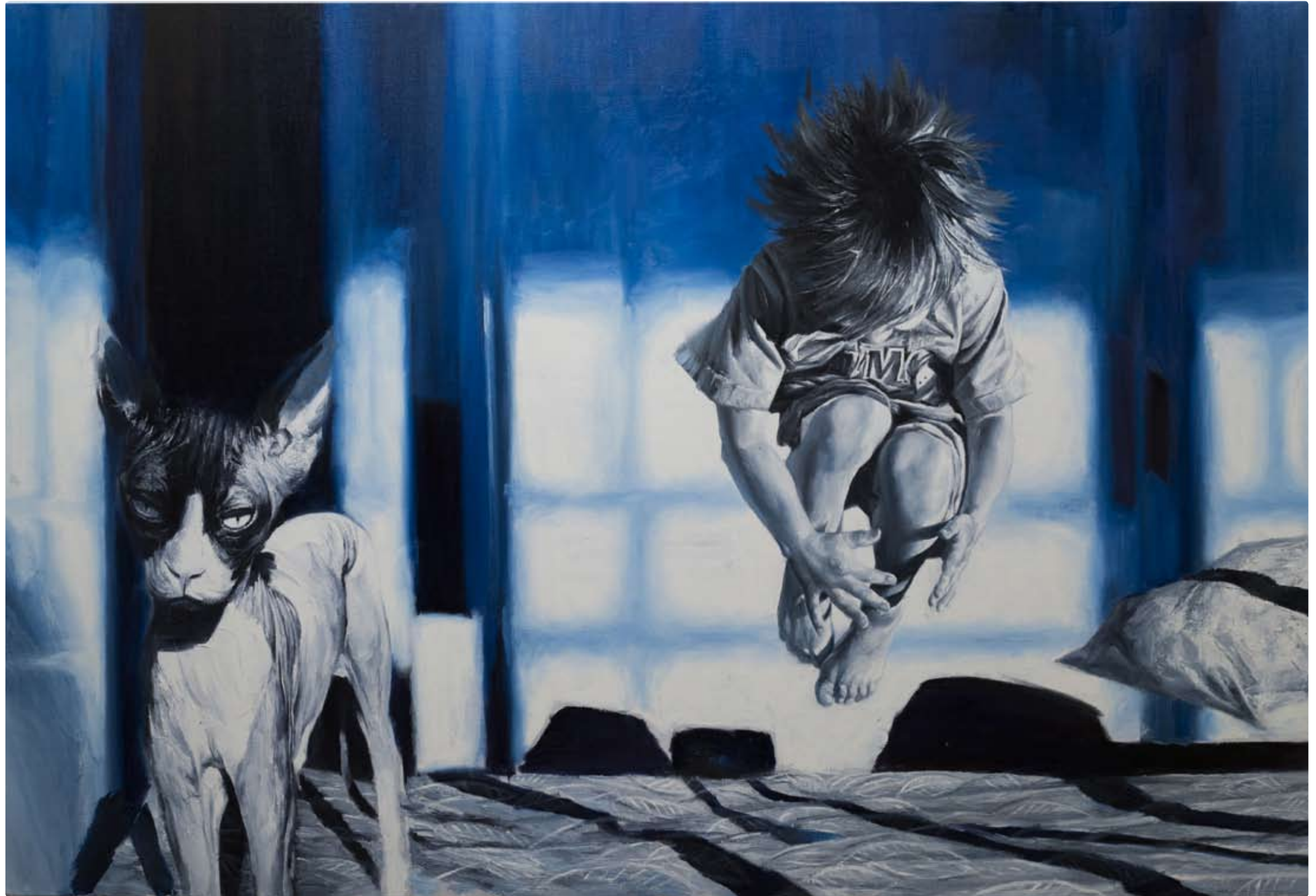
Elvis and Pavel. Oil on canvas, 110X160 cm