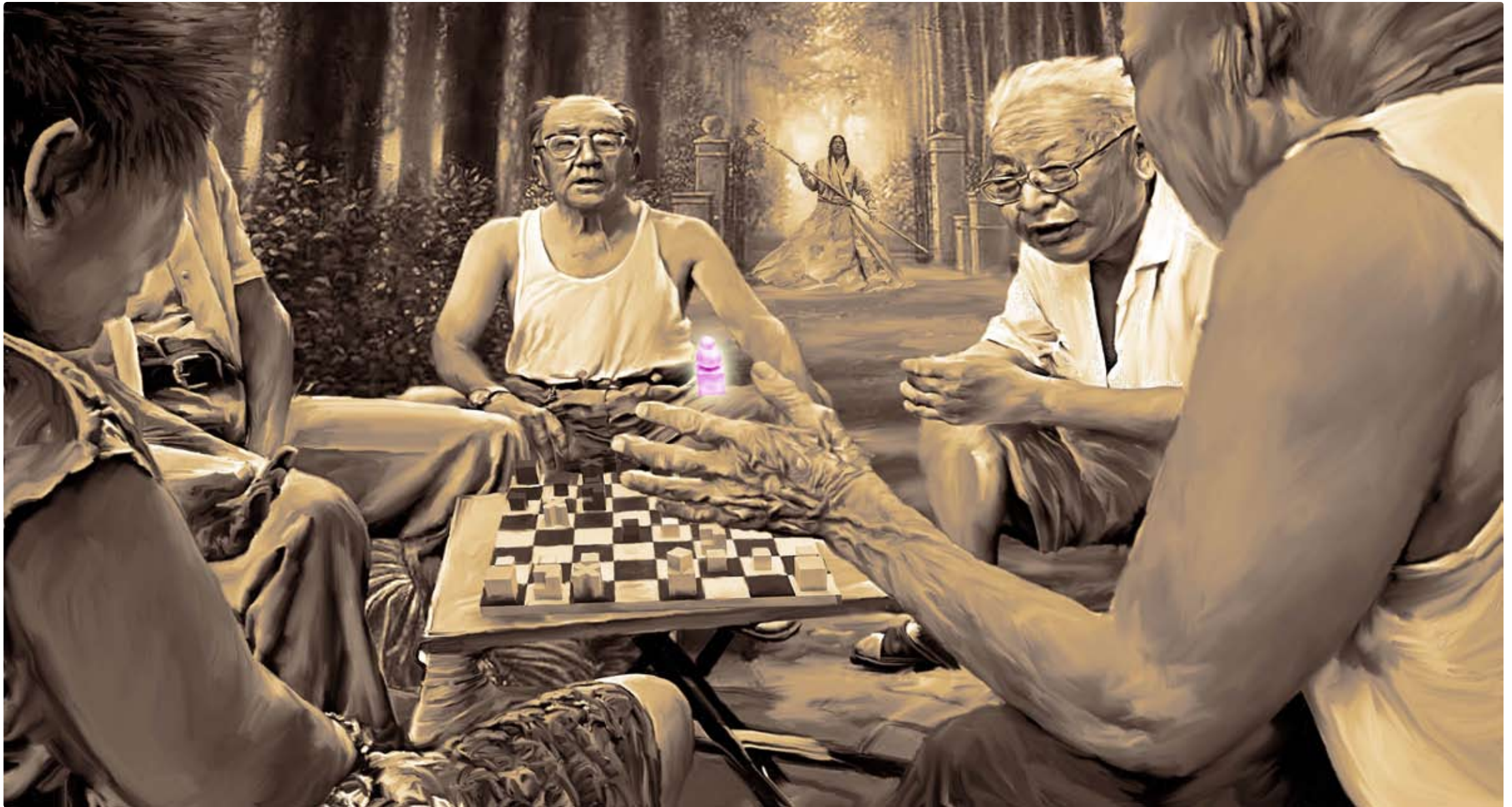
Book of Changes (sketches)