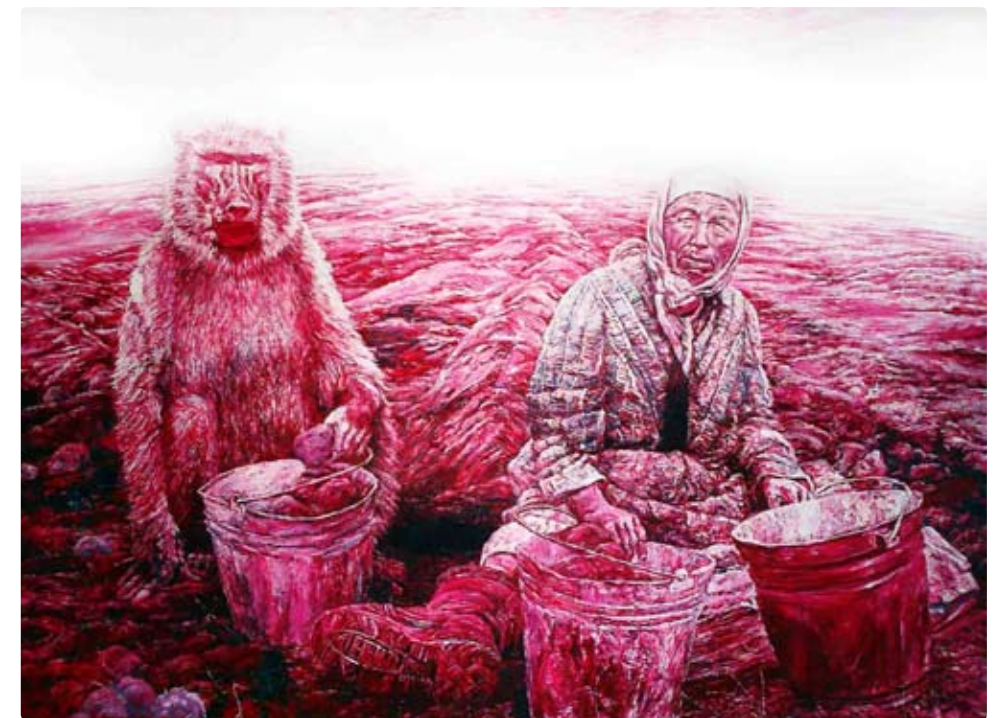
Battle For The Harvest III